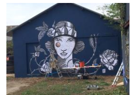
Œuvre de Erika RAIIO

Contact: 02-99-71-59-50, accès permanent par la « maison cassée », rue des chantiers