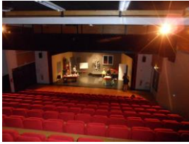
Fauteuils vides pour l'association théâtrale de Tabago

L'association théâtrale de Tabago, au vu des conditions sanitaires, regrette de ne pouvoir présenter une pièce, cette année. « Nous espérons et souhaitons vous retrouver l'an prochain, comme d'habitude, le dernier week-end de Novembre et les 2 premiers week-ends de Décembre 2021.